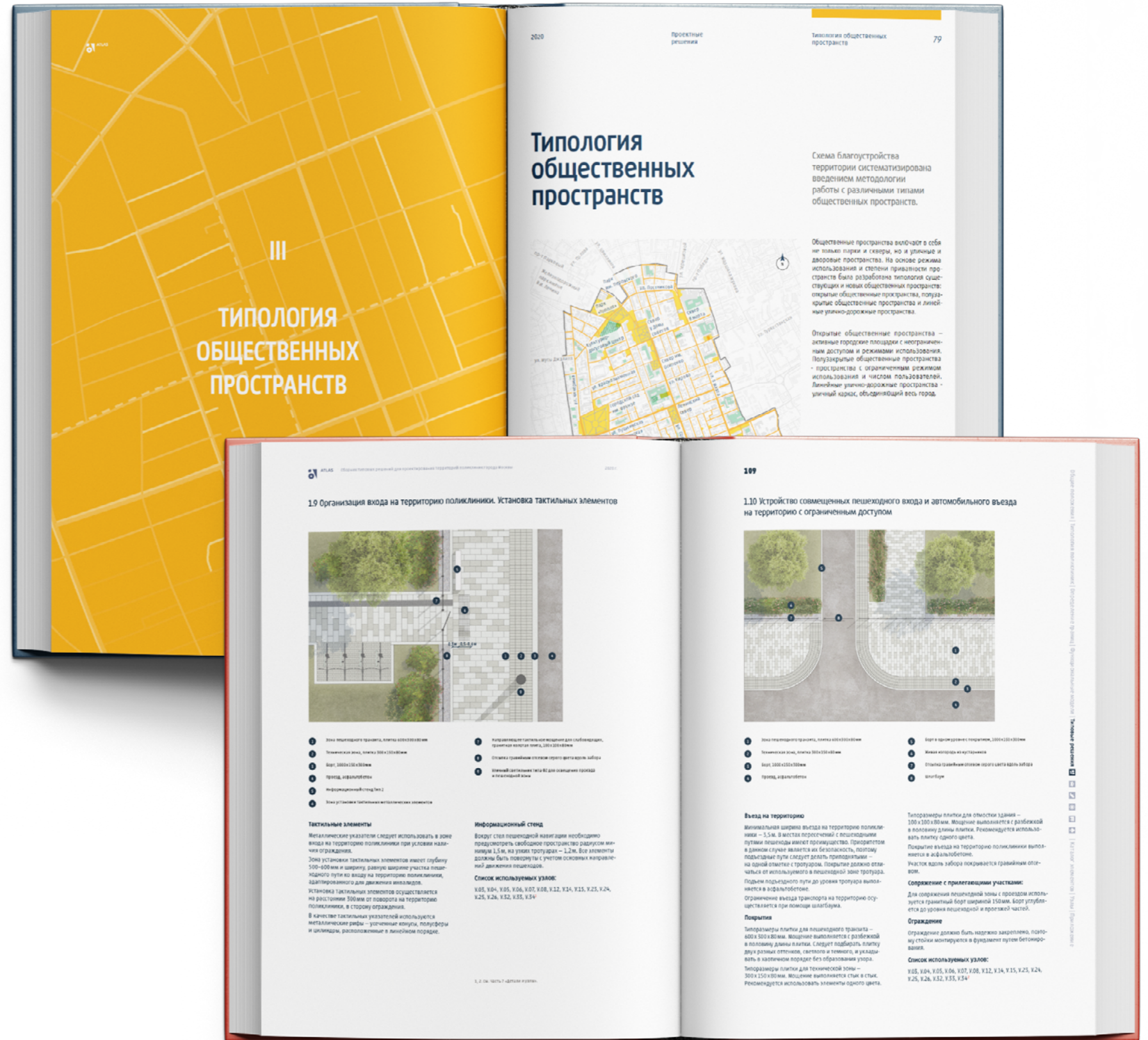
Схема благоустройства территории определяет подход к благоустройству и комплекс параметров для проектирования, нацеленные на повышение качества сельской среды, формирование и сохранения идентичности, безопасности и связанности перемещений. Это комплексное техническое задание на перспективное благоустройство.